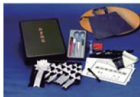
受付用品(書類箱一式)