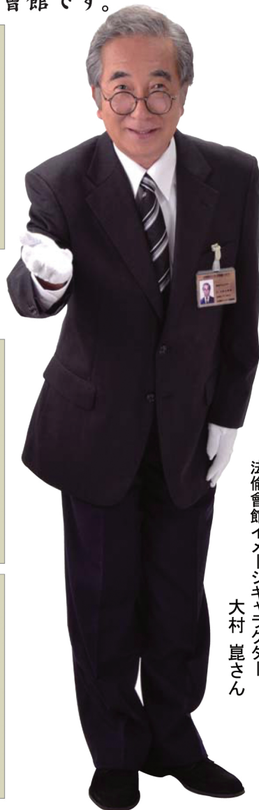
法倫會館イメージキャラクター 大村 崑さん